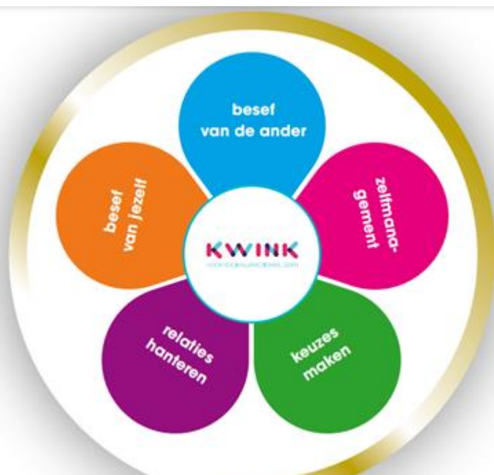
De 5 competenties voor sociaal-emotioneel leren van Kwink

De fase van afscheid, deze fase verloopt vaak wat onrustig.